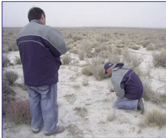
Evaluación de la profundidad de cenizas en el área afectada.

Se tomaron como base los datos proporcionados por SENASA, del año 2010-2011, los cuales poseen georreferenciación y la cantidad de animales por especie. Cabe aclarar que los datos de SENASA corresponden sólo a productores registrados, lo que implica que una proporción no determinada de productores familiares de pequeña escala no están incluidos. Se estima que la cantidad de productores minifundistas podría ser mayor (principalmente en los departamentos centro-norte de Pilcaniyeu, centro-este de Ñorquinco y centro-oeste de 25 de Mayo, afectando principalmente a los COEM Jacobacci y Comallo), pero sin variar mucho la cantidad de animales totales.