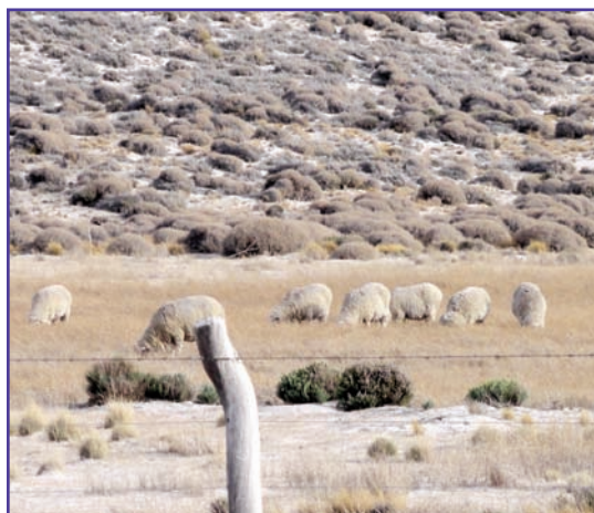
Ovejas pastoreando en mallín con cenizas.

Esta diferenciación permite resaltar las zonas y los grupos más vulnerables frente a la situación de emergencia actual.