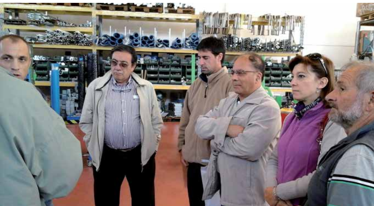
Planta industrial Campagnola-Bologna.

En relación a la presencia de políticas públicas asociadas al sector industrial, para el dueño de la firma, la principal presencia estatal está en el cobro de impuestos, cercanos al 45% de la facturación total.