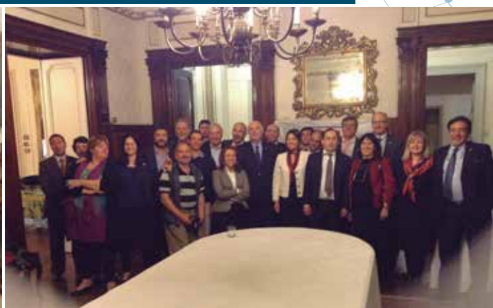
Delegación argentina y funcionarios de la Embajada Argentina en Roma.