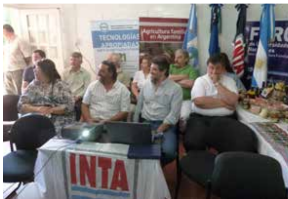
En la Patagonia, referentes de la agricultura familiar participaron del Diálogo en Red.