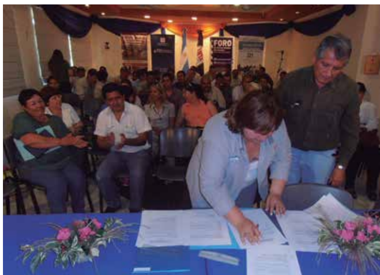
El NEA conmemora el Día de la Agricultura Familiar con la participación de los productores y firma de convenios entre el IPAF Región NEA y el Instituto Paippa de Formosa.