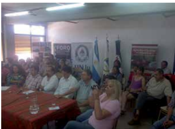
El NOA se sumó a la conmemoración de la agricultura familiar, con referentes del IPAF, la Universidad y las organizaciones de productores familiares.