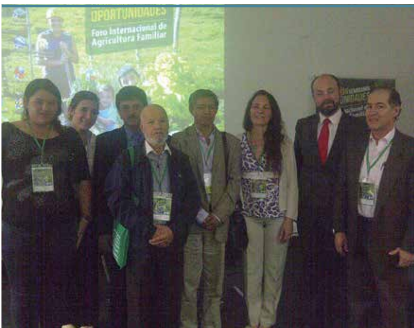
La directora del INTA CIPAF participó del Foro Internacional de Agricultura Familiar en Plaza Mayor, Medellín. Noviembre de 2014