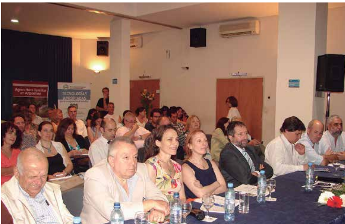
En Buenos Aires referentes del Ministerio de Agricultura, el INTA, las universidades y las organizaciones de productores se reunieron para participar del Diálogo Global en Roma y el Diálogo en Red con todas las regiones del país.

Todas las regiones del país se unieron para conmemorar el Día Internacional de la Agricultura Familiar . Los festejos se realizaron en el marco del Diálogo global sobre Agricultura Familiar que tuvo su epicentro en la sede de FAO en Roma.