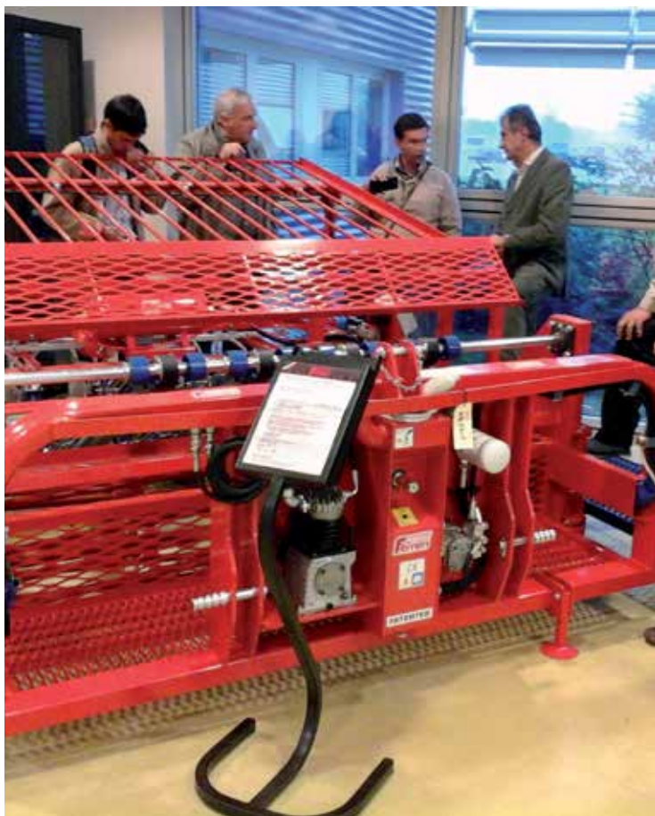
Equipamiento para siembra hortícola en la localidad de Guidizzolo.

A su vez, el relato del caso permitió observar estrategias institucionales de la propia ENEA, respecto a cómo se ha posicionado en