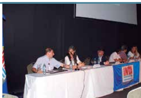
Jornada del Diálogo en Red en el Centro Regional Tucumán-Santiago del Estero.