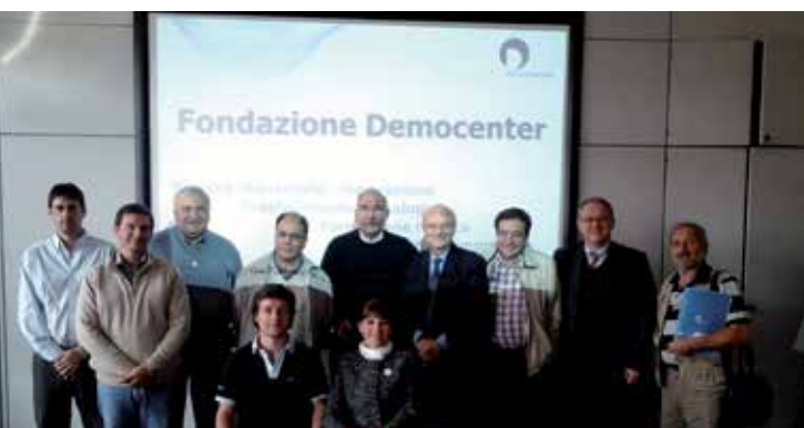
Predio del Centro de I+D Democenter Módena.

Por otro lado, el relato de las experiencias/acciones marcaron la postura italiana en relación al rol del estado, a la definición de políticas públicas en el plano regional en materia de promoción de áreas industriales, a la definición de áreas prioritarias y/o estratégicas de intervención y control estatal.