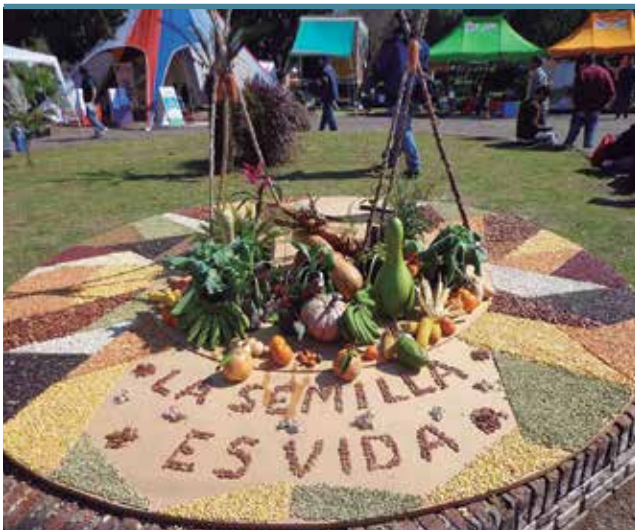
Encuentro de la Agricultura Familiar del NEA, 8 y 9 de agosto de 2014, Ciudad de Resistencia, Chaco, en el marco del Año Internacional de la Agricultura Familiar.