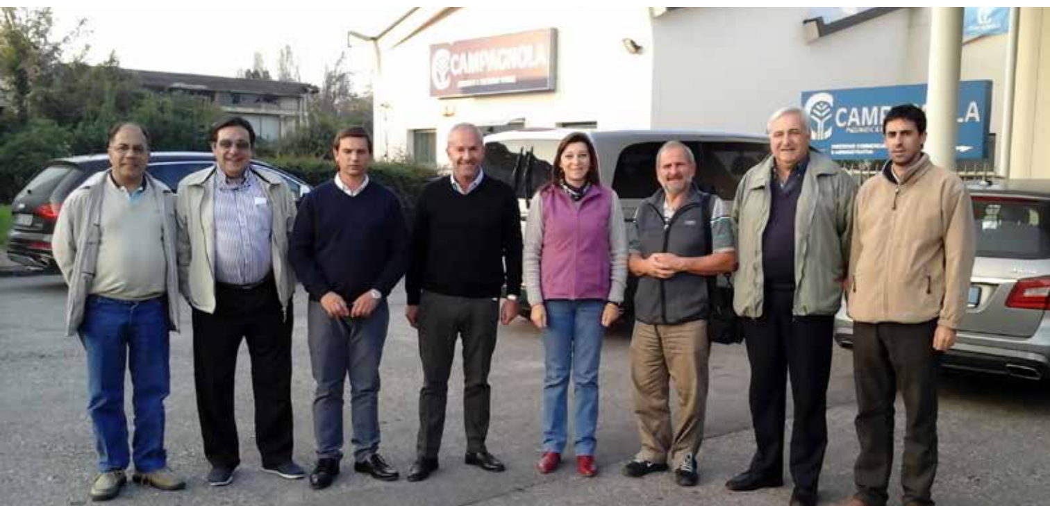
La comitiva argentina junto a PyMEs e institutos de I+D de la Comunidad Europea para conocer sus entramados industriales y las estrategias de innovación.

La PyME posee una planta principal y una planta de ensamblado en la localidad de Agna. Es una empresa muy joven, creada en 2004 por 4 socios, con más de diez años de experiencia en el rubro, que compraron dos empresas con larga trayectoria en el sector hortícola a nivel