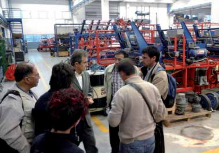
Planta industrial de Costruzione Meccaniche Ferrari.

Inicialmente se realizó una visita al show room de la PyME, donde se pudo tomar contacto con todos los productos que comercializa.