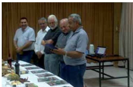
En San Juan representantes de la agricultura familiar en la Región Cuyo.