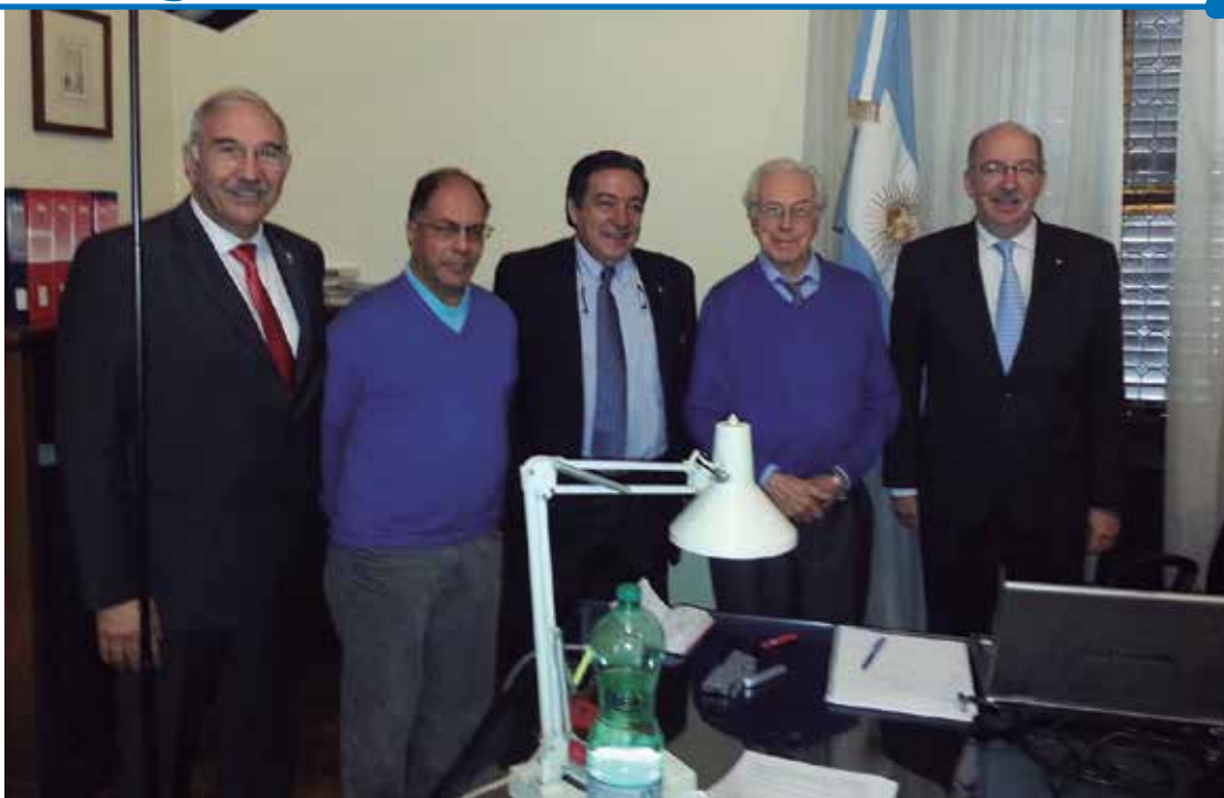
Las autoridades del INTA junto al Embajador Argentino en Roma en el marco de la Jornada Puertas Abiertas para promover la Agricultura Familiar. 28 de octubre de 2014.